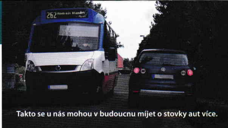
Takto se u nás mohou v budoucnu míjet o stovky aut více.

V těchto místech by se mělo začít stavět.