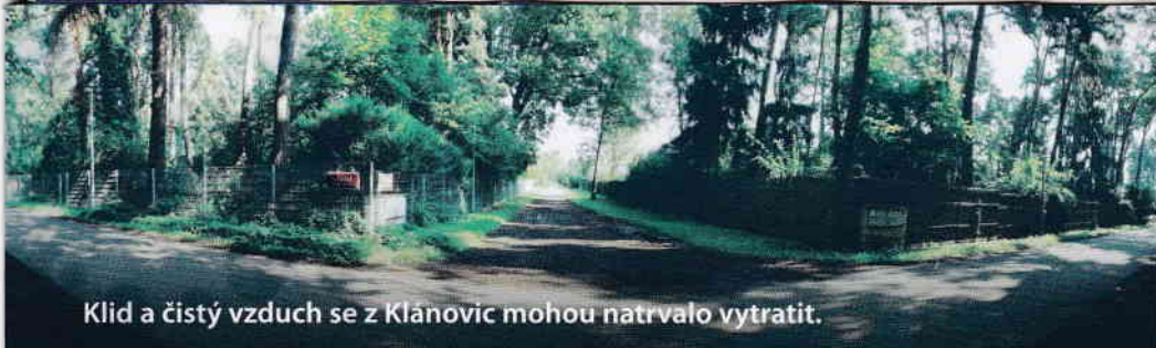
Klid a čistý vzduch se z Klánovic mohou natrvalo vytratit.