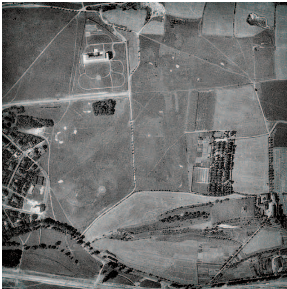
Letecké snímkování 1938

Od začátku 30. let se vedení klubu snažilo stabilizovat situaci hřiště buď uspořádáním vztahů „s městem a vojskem“, jejichž výsledkem by byl „dlouhodobý pacht“, anebo nalezením nové lokality. Obava, že město najde pro armádu jiné cvičiště a pozemky dosavadního rozprodá na komerční výstavbu, byla stále reálnější. Postupně proto byly prověřovány možnosti na Závisťi, v Suchdole, Chuchli, Jílovišti,